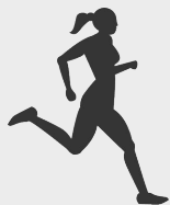
Tập vận động

Có nhiều việc chúng ta có thể làm để giảm nguy cơ này. Phần lớn bệnh tim có thể phòng ngừa được.