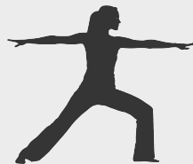
Kiểm soát căng thẳng