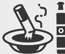
Không sử dụng các sản phẩm thuốc lá